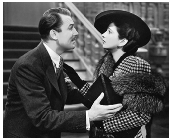
1941 THE MAN WHO LOST HIMSELF d'Edward Ludwig avec Kay Francis