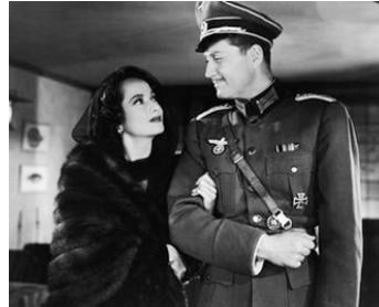
1943 DUEL DANS LA NUIT (First comes Courage) de Dorothy Arzner avec Merle Oberon