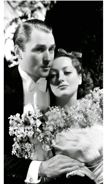
1935 VIVRE SA VIE (I live my Live) de W. S. Van Dyke avec Joan Crawford