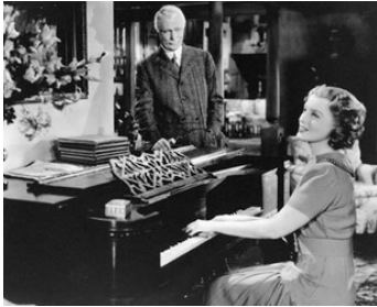
1941 CHAGRIN D'AMOUR (Smilin' through) de Frank Borzage avec Jeanette MacDonald