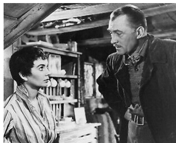
1954 UNE BALLE VOUS ATTEND (A Bullet is waiting) de John Farrow avec Jean Simmons