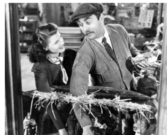
1940 THE LADY IN QUESTION de Charles Vidor avec Rita Hayworth