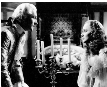
1937 LE GRAND GARRICK (The Great Garrick) de James Whale avec Olivia de Havilland