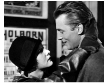
1928 UN CRI DANS LE MÉTRO (Underground) d'Anthony Asquith avec Elissa Landi