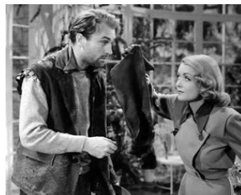
1938 MADAME ET SON CLOCHARD (Merrily we live) de Norman Z. McLeod avec Constance Bennett