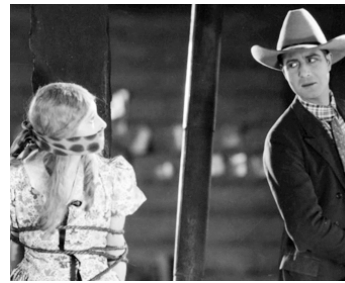
1928 UN DRAME AU STUDIO (Shooting Stars) d'Anthony Asquith avec Annette Benson