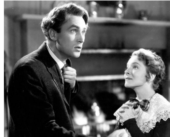
1935 CE QUE FEMME SAIT (What every Woman knows) de Gregory La Cava avec Madge Evans