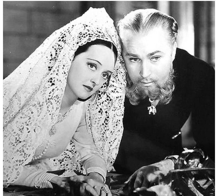
1939 JUAREZ (Juarez) de William Dieterle avec Bette Davis