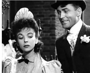
1943 ET LA VIE RECOMMENCE (Forever and a Day) d'Edmund Goulding avec Ida Lupino