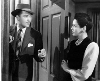
1942 UNE NUIT INOUBLIABLE (A Night to Remember) de Richard Wallace avec L. Young