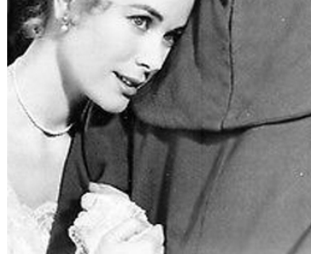
1964 7 HOMMES CONTRE LA MORT (The Cavern) d'E. G. Ulmer avec John Saxon, R. Schiaffino