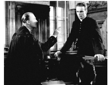
1953 LA LOI DU SILENCE (I confess) d'Alfred Hitchcock avec Montgomery Clift