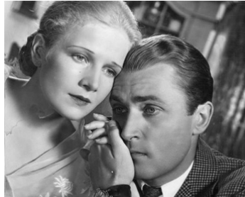
1934 LA FONTAINE (The Fountain) de John Cromwell avec Ann Harding