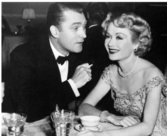
1948 MADAME ET SES PANTINS (Smart Woman) d'Edward A. Blatt avec Constance Bennett