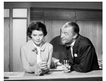
1959 RIEN N'EST TROP BEAU (The Best of Everything) de Jean Negulesco avec Diane Baker