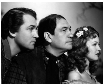
1939 CAPITAINE FURIE (Captain Fury) de Hal Roach avec Victor McLaglen, June Lang