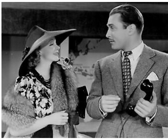
1940 J'AI LOUÉ MA FEMME (Hired Wife) de William A. Seiter avec Rosalind Russell