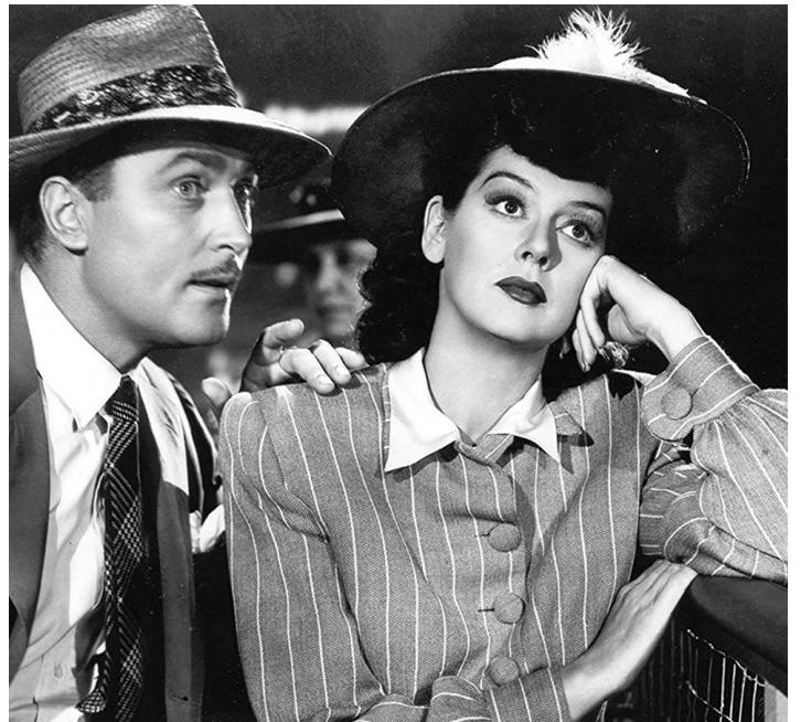
1942 MA SEUR EST CAPRICIEUSE (My Sister Eileen) d'Alexander Hall avec Rosalind Russell