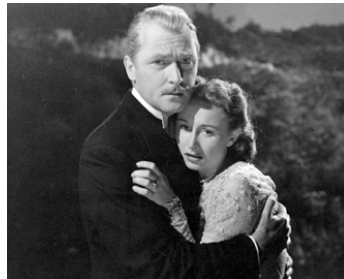
1948 TAM-TAM SUR L'AMAZONE (Angel on the Amazon) de John H. Auer avec Vera Ralston