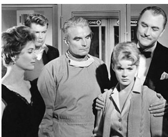
1961 SUSAN SLADE de D. Daves avec D. McGuire, Troy Donahue, Kent Smith, Connie Stevens