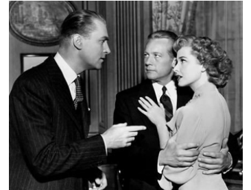
1946 LE MÉDAILLON (The Locket) de John Brahm avec Gene Raymond, Laraine Day