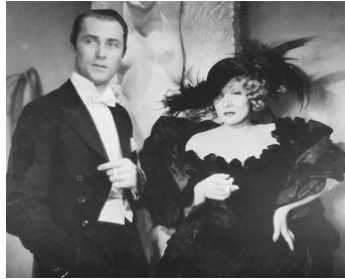
1933 LE CANTIQU DES CANTIQUES (Song of Songs) de R. Mamoulian avec Marlene Dietrich