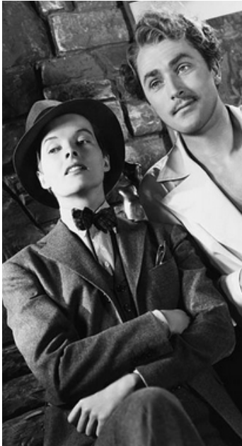
1935 SYLVIA SCARLETT (Sylvia Scarlett) de George Cukor avec Katharine Hepburn