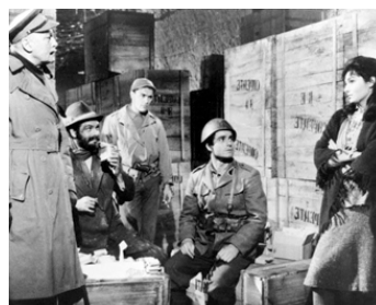
1967 LES RICHES FAMILLES (Rosie!) de D. Lowell Rich avec J. Farrentino, Sandra Dee, R. Russell