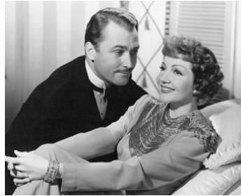
1941 LA FOLLE ALOUETTE (Skylark) de Mark Sandrich avec Claudette Colbert