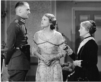
1930 THE W PLAN de Victor Saville avec Madeleine Carroll, Mary Jerrold