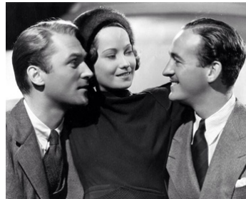
1936 L'ENNEMIE BIEN-AIMÉE (Beloved Enemy) de H. C. Potter avec Merle Oberon, David Niven