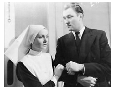
1940 VEILLEUSE DE NUIT (Vigil in the Night) de George Stevens avec Anne Shirley