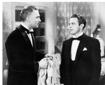
1940 MON FILS, MON FILS (My Son, My Son) de Charles Vidor avec Louis Hayward