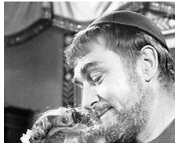
1956 LE CYGNE (The Swan) de Charles Vidor avec Grace Kelly