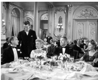
1953 TITANIC (Titanic) de Jean Negulesco avec Clifton Webb, Barbara Stanwyck